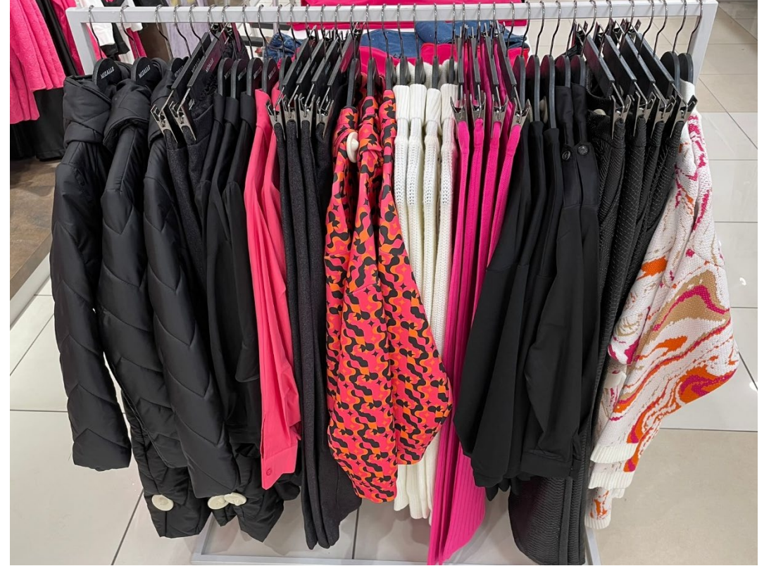
Mont, Pantolon, Gömlek, Pantolon, Sweatshirt, Bolero, Pantolon, Bluz, Pantolon, Hırka

M2MZ1010130058 - M1YT1030160083 - M2MZ1010130055 M1MZ1010130061 - M2MZ1010130054 - M2MZ1010130071