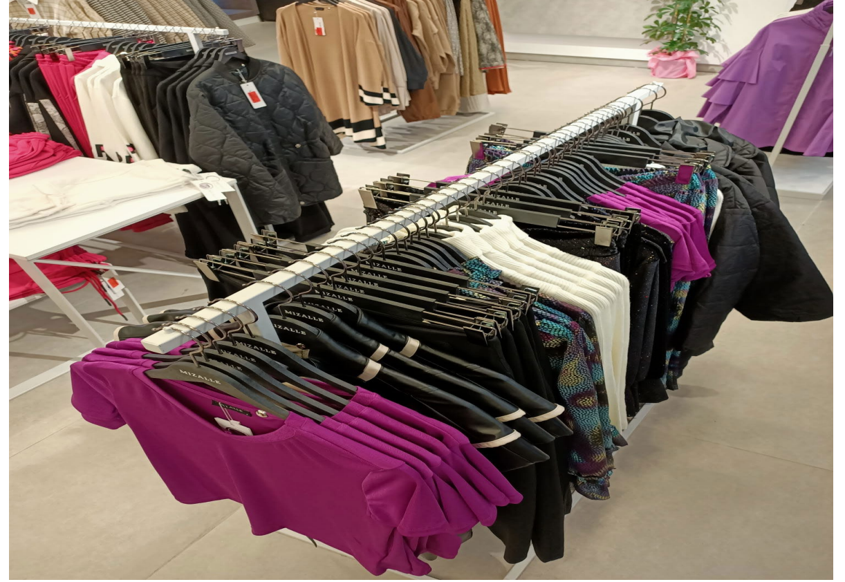
T-Shirt, Yelek, Pantolon, Bluz, Kazak, Pantolon, T-Shirt Etek, Mont