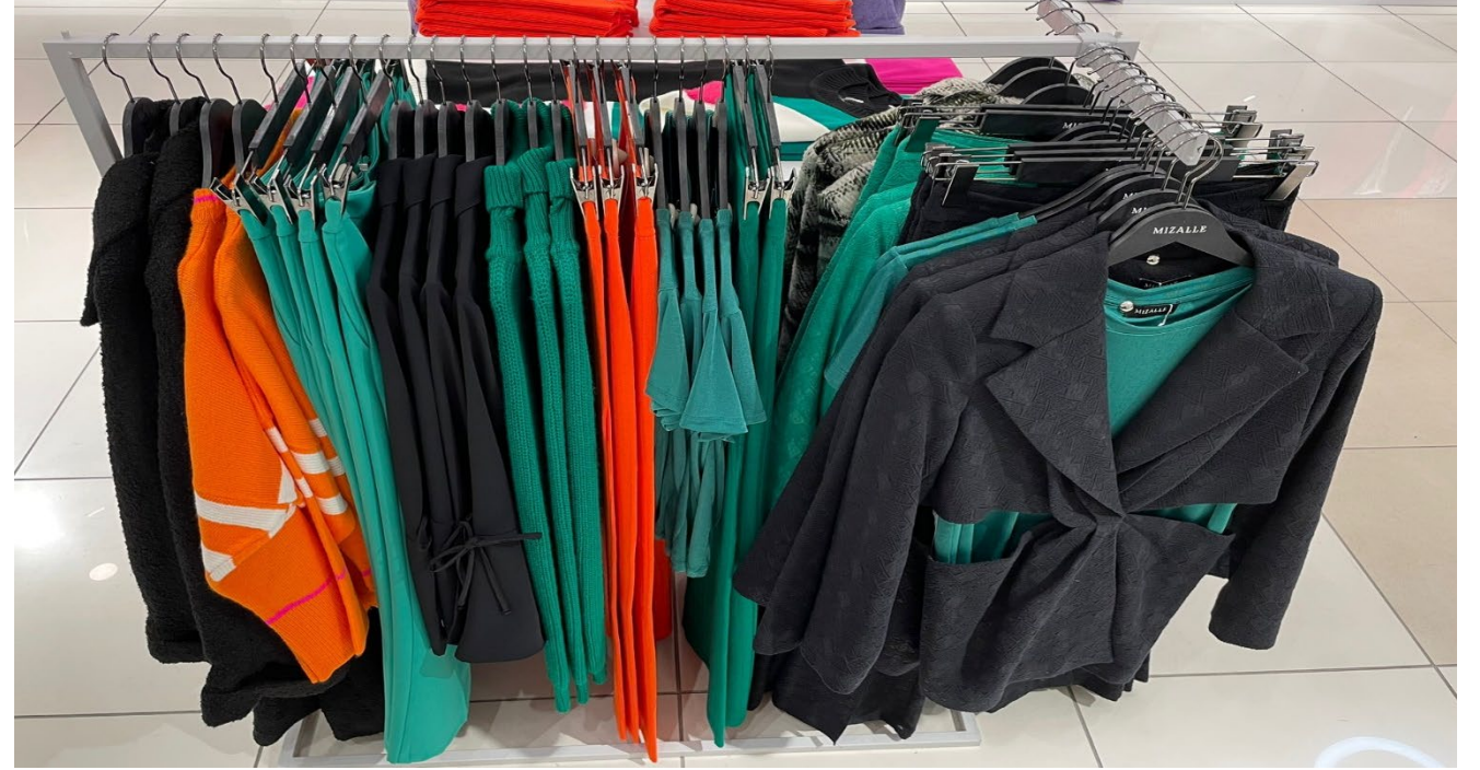
Kaban, Triko Kazak, Pantolon, Gömlek, Bolero, Pantolon T-Shirt, Pantolon, Ceket, Pantolon, Kaban

M1MZ1030100047 - M1MZ1030160029 - M1MZ1030160030