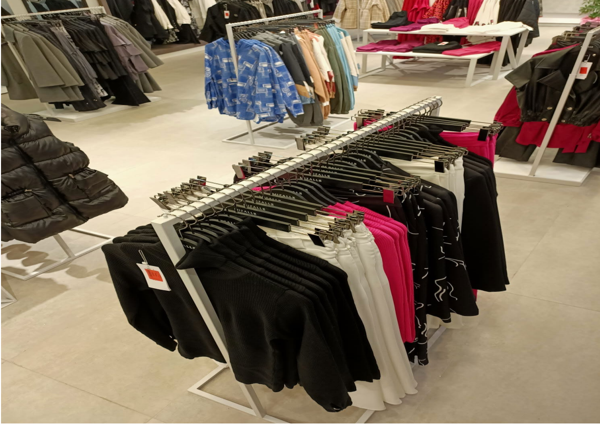
Kazak, Pantolon, Kazak, Pantolon, Ceket, Pantolon, Kazak, Pantolon