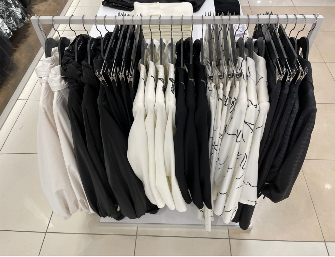
Kaban, Pantolon, Ceket, Ceket, Pantolon, Ceket Pantolon, Ceket