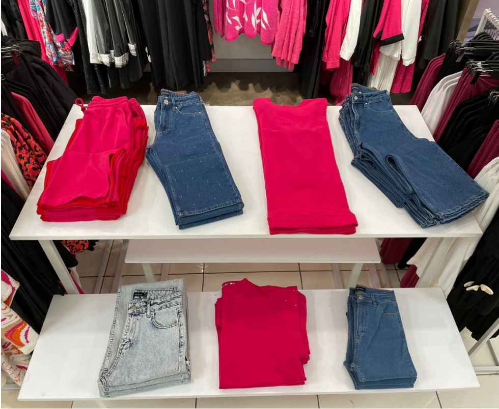
Eşofman Altı, Pantolon, T-Shirt, Pantolon Pantolon, Sweatshirt, Pantolon

M2MZ1010130058 - M1YT1030160083 - M2MZ1010130055 M1MZ1010130061 - M2MZ1010130054 - M2MZ1010130071